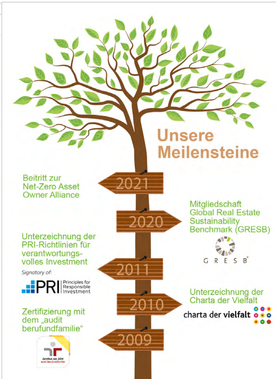
Wesentliche Nachhaltigkeitsaktivitäten der Bayerischen Versorgungskammer, der gesetzlichen Geschäftsführerin der Bayerischen Ärzteversorgung.