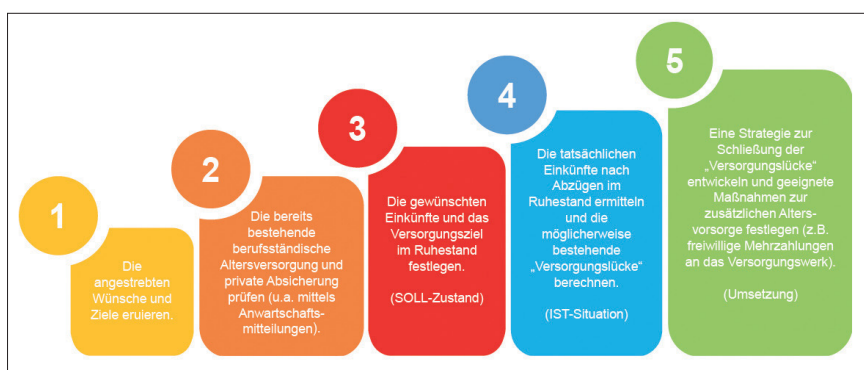
Abb.3 Die optimale Planung des Ruhestands

Der Übergang zur nachgelagerten Besteuerung ist rechtlich heikel. Was im Rahmen der Beitragszahlung versteuert wurde, darf der Fiskus im Alter nicht ein zweites Mal belasten. Der Bundesfinanzhof (BFH) hatte daher vor Kurzem über zwei Klagen zu entscheiden, bei denen eine unrechtmäßige Doppelbesteuerung in der laufenden Übergangphase bemängelt wurde. Kurzgefasst: Das oberste Finanzgericht geht durchaus von dem Risiko einer doppelten Besteuerung künftiger Rentnerjahrgänge aus, auch wenn er diese in den beiden individuellen Fällen verneint hat. Inzwischen haben beide Kläger – darunter ein Zahnarzt – beim Bundesverfassungsgericht (BVerfG) Verfassungsbeschwerden eingelegt. Der besondere Wert dieses Urteils besteht sicherlich darin, dass die Richter Berechnungsparameter für die Ermittlung einer etwaigen doppelten Besteuerung festgelegt haben. So dürfen nach Einschätzung des BFH weder der Grundfreibetrag noch Kranken- und Pflegeversicherungsbeiträge in die Berechnung des steuerfreien Anteils der Rente mit einbezogen werden. Vor diesem Hintergrund ist heute schon absehbar, dass es durch die neue Bundesregierung zu Anpassungen bei der Rentenbesteuerung kommen wird.